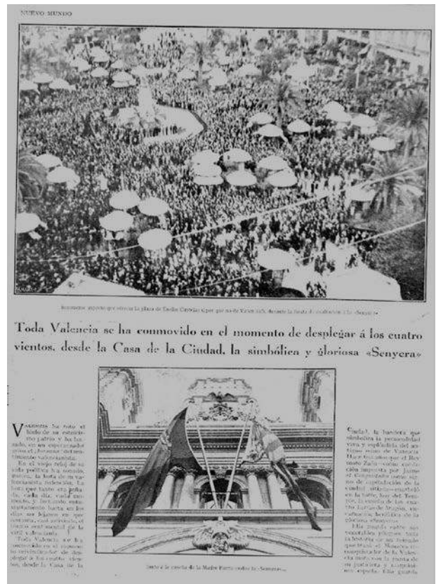
Revista Nuevo Mundo , 1 d'agost de 1930. La Senyera oneja oficialment en el balcó de l'Ajuntament de València.

Els alcaldes de les tres capitals acabaren abraçant-se i besant la Senyera. A pesar de que la transcripció dels parlaments se feu en castellà, sabem que els alcaldes parlaren en valencià perquè