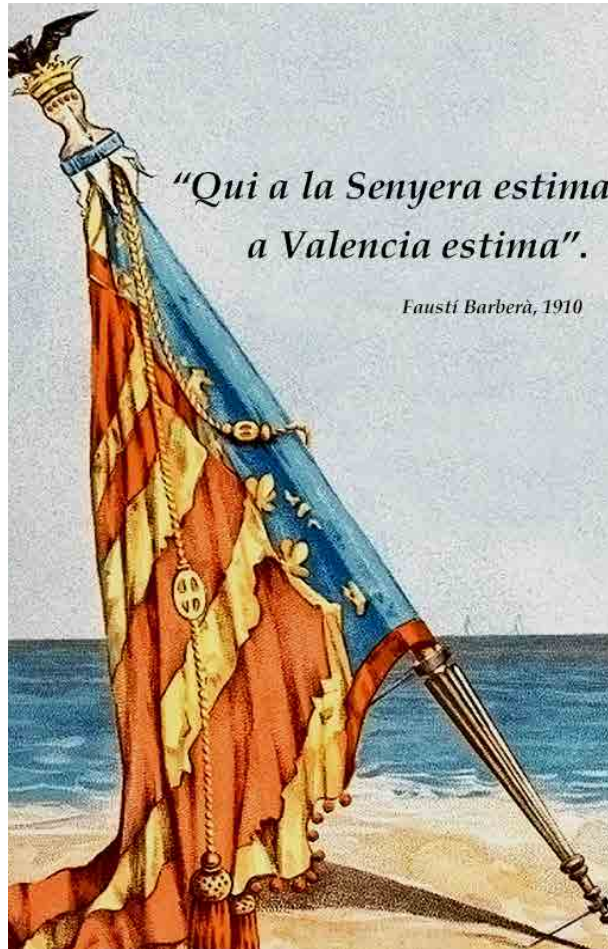
J. Barreira. Fragment de la portada de L'Himne Valencià

Han amerat de dubtes a eixe poble que busca veritats en l'hora blava deixant caure una boira que li oculta la font en llibertat de l'esperança. Ningú no sap per qué la veu es trenca, ningú no sap qui cobra ni qui paga, i yo dic que és València la que plora, per tant de fill postís i tanta estafa.