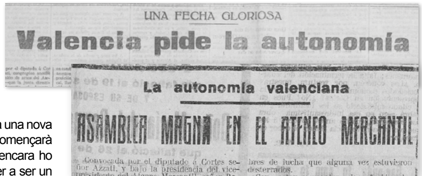
▲ La premsa de l’època es fa res del procés per a demanar l’autonomia política.