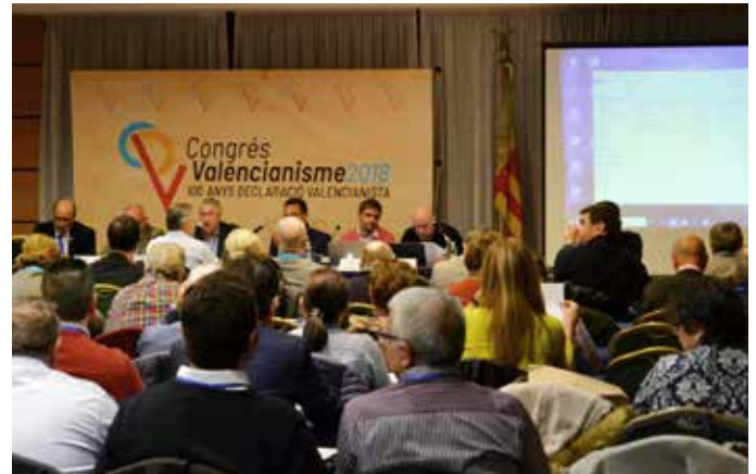
▲ Un moment de la celebració del Congrés.

A l'hora de parlar de valencianisme es va vore que hi ha un futur: se plantejaren vies d'actuació, accions de futur i, es feu notar que encara que el moviment valencianista és molt igualitari en quan a participació de gènere, cada vegada hi ha més implicació de les dones, a les quals s'animà a que ocuparen càrrecs directius en les associacions.