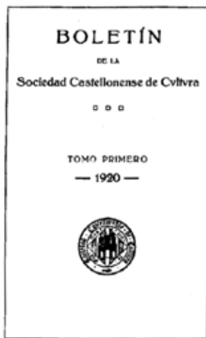
▲ Primer bolletí de la Societat Castellonenca de Cultura (1920)