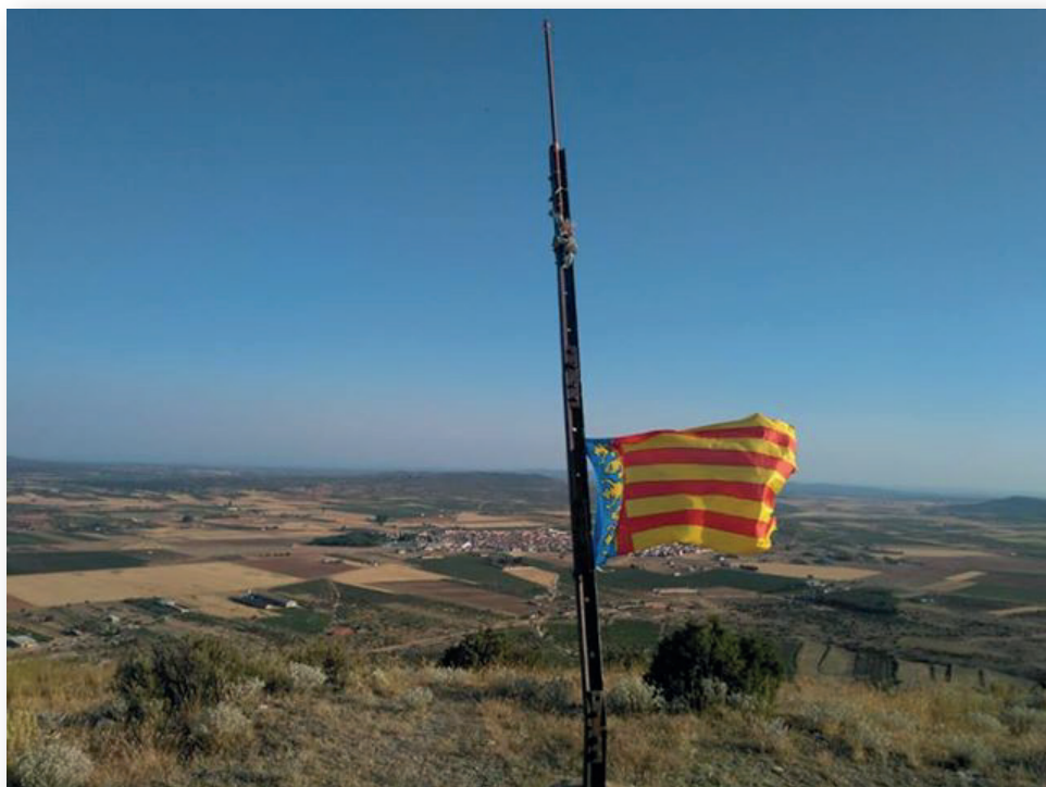
Foto de Javier Navarro, guanyadora de la campanya "Senyeres al balco" 2018.