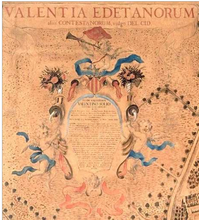
Cartela barroca, coronada en l'escut de València, situada en l'angul superior esquerre del pla, en la que s'inclouen notícies sobre l'història de València. Pla de València, 1704