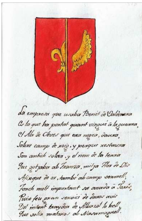
Escut heràldic dels Valldaura Image i text procedents de l'obra catalogada com Trobes de Mossen Febrer, una possible còpia manuscrita sense datació.