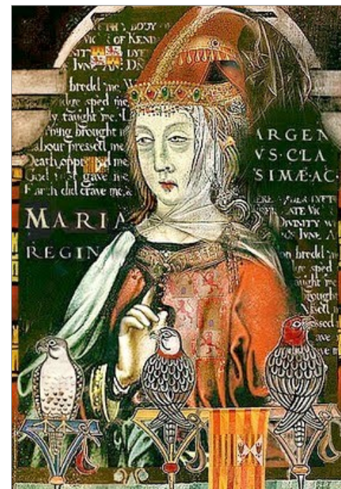
Retrat alegoric de Maria de Castella

(Plça. de St.Vicent Ferrer. Valencia ciutat)