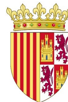
Armes de Maria de Castella

La reina Maria fallí en el Palau Real en 1458, als 57 anys, assitida pel mege i escriptor Jaume Roig. Fon soterrada, com ella desijava, en una zona del claustre del Monasteri que ella havia ajudat a consolidar. El seu sepulcre, gòtic, es troba junt a la capçalera de l'iglesia, en la zona claustral; el seu sarcòfac, decorat en les armes d'Aragó i Sicília, junt a les de Castella i possible simbologia vinculada en la Trinitat, es troba baix un arc conopial de finíssima traça.