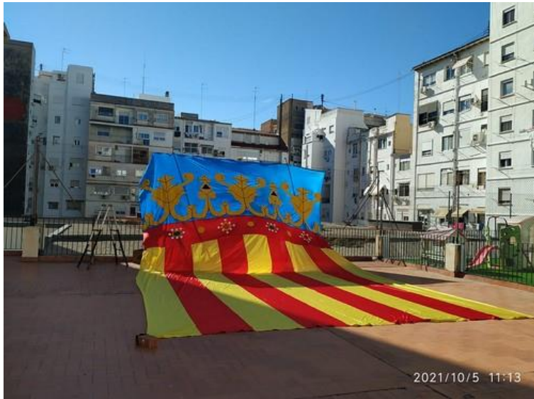
Foto de Lola García Broch, guanyadora del concurs "Senyeres al Balco" 2021.