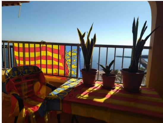
Foto de Pepigües Cárcel, guanyadora del concurs "Senyeres al balco" 2023.